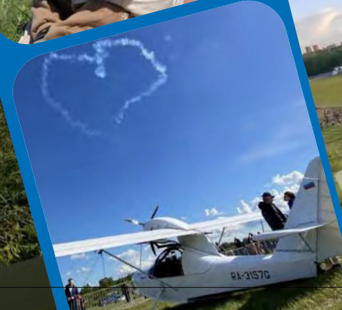
@MYSKYMSK Спасибо за чудесные впечатления