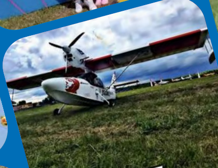
@MYSKYMSK СПАСИБО ЗА ЭТОТ ПРАЗДНИК АВИАЦИИ!!!