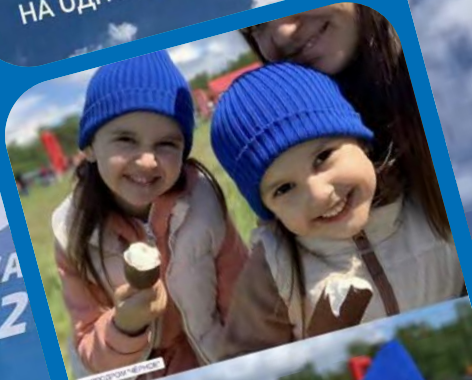
НА ОДНОМ ДЫХАНИИ 🍦